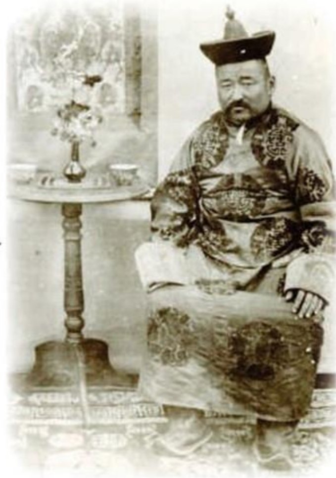
Егүзэр хутагт Галсандаш

Байгаль хамгаалах талаар Егүзэр хутагтын хийсэн үйл ажиллагааг нэрлэж, ач холбогдлыг тодорхойлоорой.