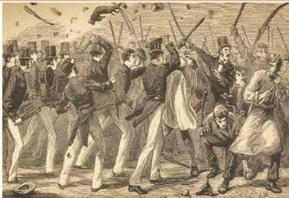
Зураг 5.6. Английн хувьсгалын үйл явц

Түүхэн үүднээс намын үүслийг XVII зууны сүүл XVIII зууны эхэн үед хамааруулдаг. Энэ үед Баруун Европ, АНУ-д засаглалын шинэ харилцаа бүхий улс төрийн систем үүсэж эхэлсэн түүхтэй. Иймд улс төрийн намын үүсэл нь Франц, Английн хувьсгалууд, АНУ-ыг байгуулах тэмцэл, хөдөлгөөн зэрэгтэй холбогддог. Бүгд найрамдах төрийн шинэ хэлбэр тогтох үйл явцад олон нийтийг төлөөлөх, засаглалыг зохион байгуулах байгууллага үүссэн нь улс төрийн нам юм.